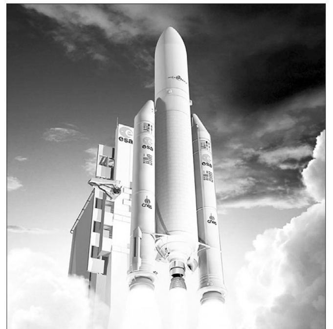
Сторінку підготував Андрій Яцик.

Він уточнив, що проектом федеральної космічної програми на 2016-2025 роки передбачається залучити 2400 млрд рублів. Даний варіант на 800 млрд рублів менший, ніж передбачалося спочатку.